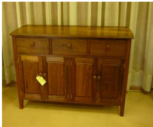
Brian Addis se pragtige buffet