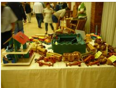
'n Deel van die houtspeelgoed by die uitstalling

Ten einde aan diegene wat nie kon bywoon nie 'n klein idee te gee van dit wat op die dag plaasgevind het, word 'n paar foto's hierby ingesluit. Dit is geensins bedoel om volledig te wees nie, en is ook nie noodwendig belangriker as iets anders wat die dag plaasgevind het nie. Dit word vertrou dat hierdie beeldmateriaal sommige van ons sal inspireer om daarna te streef om ook items van sulke hoë gehalte te lewer.