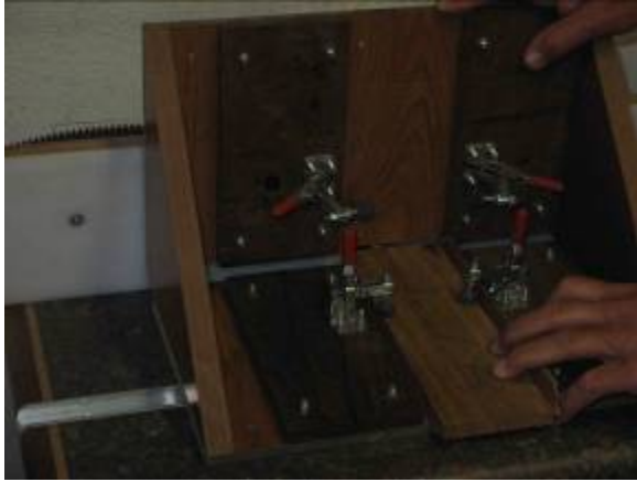
Figuur 1: Sny van die lock mitre