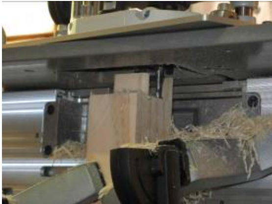
Figuur 2: Sny van tap met Leigh FMT

Daarna het Andreas die Leigh FMT vir sny van tap en gat voë gedemonstreer. 'n Baie maklike manier om die tipe voeg akkuraat teen enige moontlike hoek te sny.