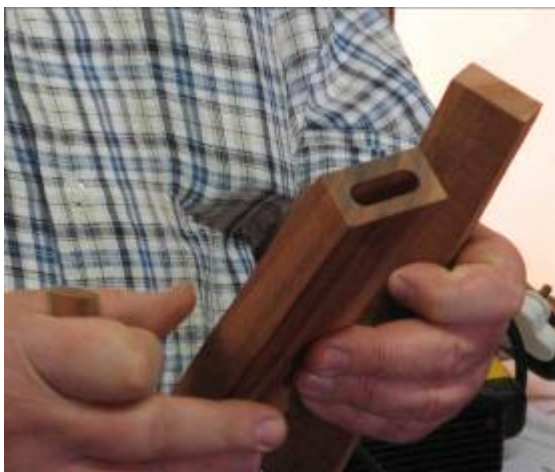
Figuur 3: Floating tennon

Dit is opgevolg deur Douglas wat getoon het hoe 'n floating tennon moet lyk en hy het vertel hoe dit gemaak kan word.