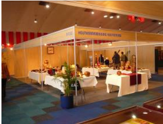
Die draaiers se stalletjie by 50-Plus

Hoewel ons lede hul kant gebring het met 'n baie goeie poging, was die opkoms van die publiek nie goed nie en word daar gehoop dat die laaste twee dae 'n oplewing sal toon. Die mense wat wel die uitstalling bygewoon het was werklik beïndruk met die items wat ons ten toon gestel het. Ons het ook 'n hele paar navrae oor die vereniging ontvang.