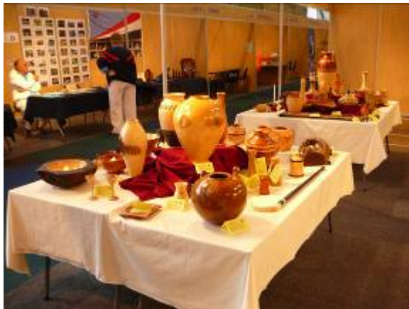
Die een helfte van ons gedraaide items